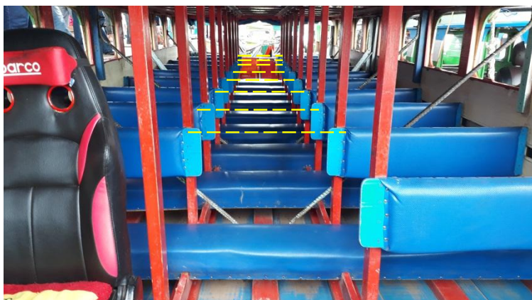
Gambar 4: ilustrasi kondisi internal Awet Muda . Garis putus-putus menunjukkan papan menerus. Foto diambil menghadap buritan dari kapal yang serupa dengan kapal Awet Muda

Terkait dengan kondisi teknis, pemilik kapal memperkirakan umur kapal dapat bertahan selama