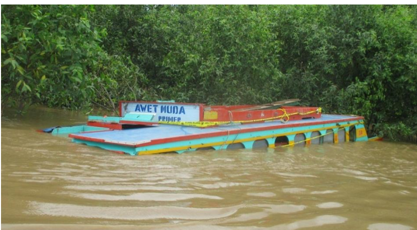
Gambar 1: Kondisi Awet Muda yang bergeser ke tepi sungai setelah kejadian

Karena kecepatan kapal yang cukup tinggi beberapa kali kapal mengalami hampasan ( slamming ) yang kuat dengan gelombang sungai. Sekitar pukul 17.30 WIB, bagian haluan kapal tiba-tiba rusak dan patah. Hal ini menyebabkan air mulai masuk ke dalam lambung kapal dan perlahan kapal tenggelam. Para penumpang yang mengetahui kejadian ini mulai bereaksi dengan berupaya meloloskan diri dari kapal. Penumpang yang berada di posisi atap langsung menceburkan diri ke sungai sedangkan yang berada di dalam berupaya meloloskan diri melalui pintu haluan dan buritan maupun jendela-jendela samping kapal. Serang berupaya membalikkan putaran mesin kapal untuk mengurangi volume air yang masuk ke dalam ruang akomodasi.