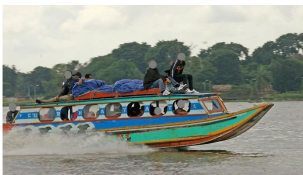
Gambar 5: kondisi badan kapal yang terangkat pada saat kapal melaju dengan kecepatan tinggi. (Ilustrasi untuk kapal yang serupa dengan Awet Muda)

Pada saat haluan kapal mengalami kerusakan, air sungai masuk ke dalam lambung kapal. Pada saat itu terjadi penambahan berat kapal sekaligus hilangnya daya apung kapal. Kerusakan haluan kapal disebabkan adanya gaya hempas berulang ( slamming force ) pada bagian struktur bawah pada saat kapal melaju dan menghantam gelombang sungai (Gambar 5).