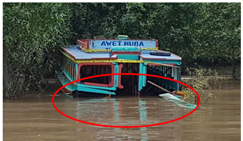
Gambar 3: kerusakan bagian haluan kapal

Serang memiliki surat keterangan kecakapan (SKK) yang dikeluarkan oleh Dinas Perhubungan Kota Palembang. Berdasarkan keterangan pemilik, Serang sudah lama mengoperasikan